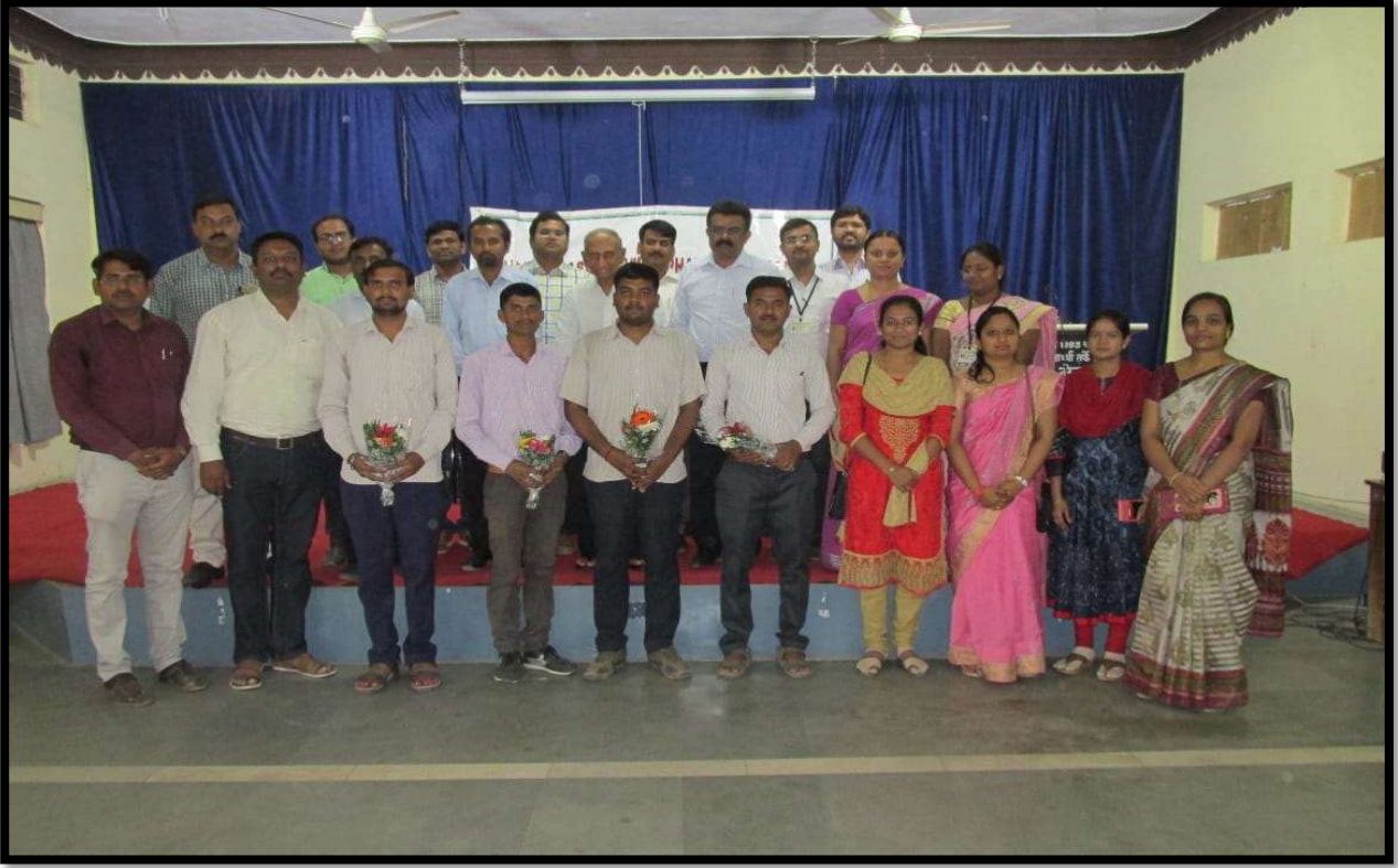
Felicitation of GPAT QUALIFIED students by Management, Principal and Teaching Staff ( A.Y.2018-19)