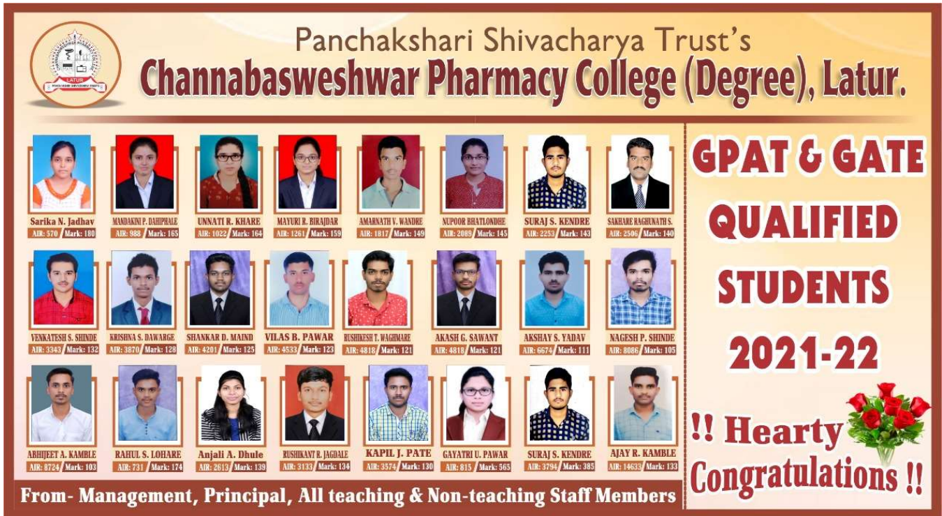
Felicitation of GPAT & GATE QUALIFIED students by Management, Principal and Teaching Staff ( A.Y.2021-22)