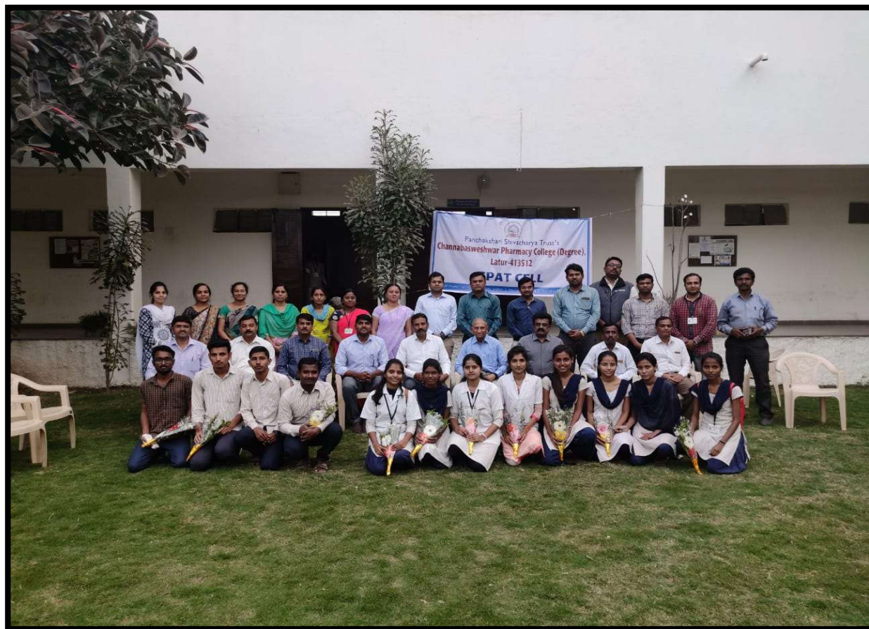
Felicitation of GPAT QUALIFIED students by Management, Principal and Teaching Staff ( A.Y.2019-20 )