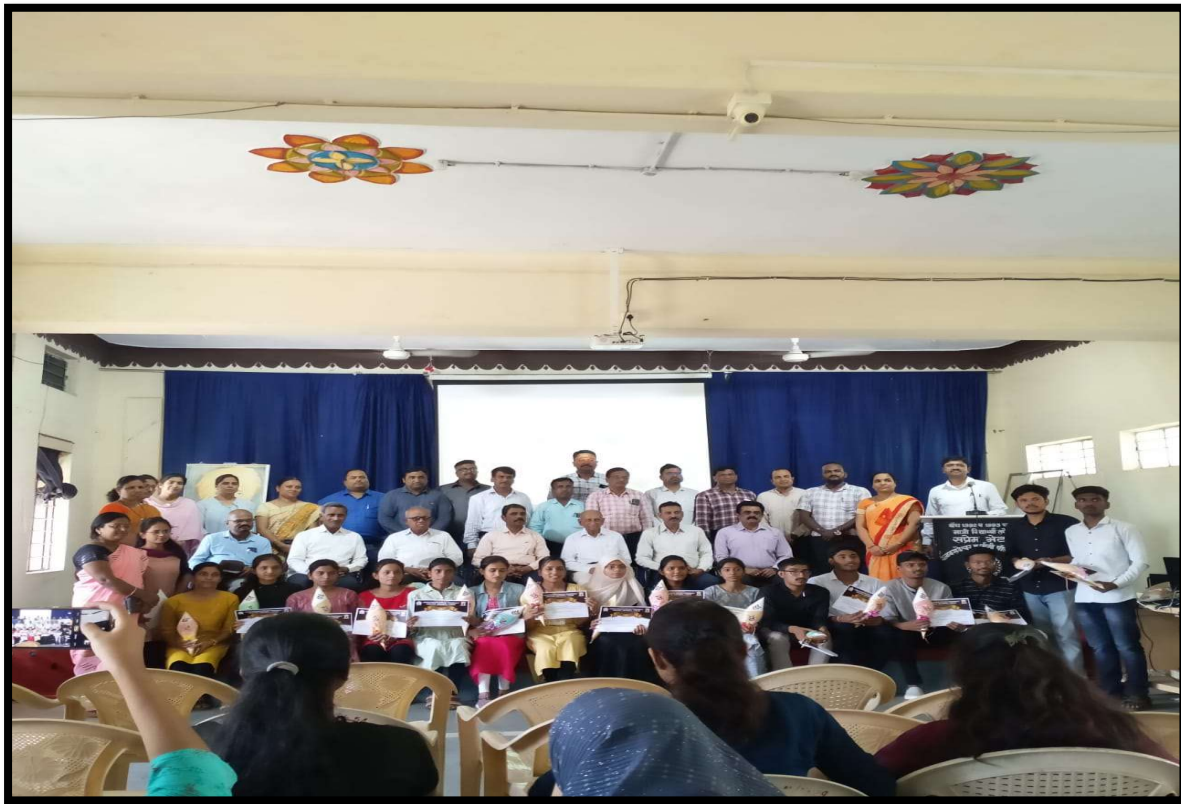
Felicitation of GPAT & GATE QUALIFIED students by Management, Principal and Teaching Staff ( A.Y.2022-23)

From- Management, Principal, All teaching, Non-teaching Channabasweshwar Pharmacy College, Latur.